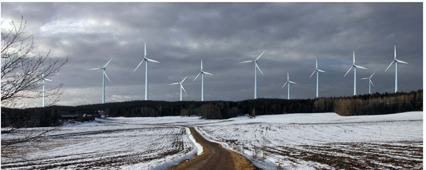
Om två vindkraftverk skymmer varandra har jag dragit isär dem något